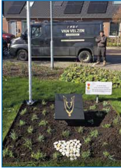
Op de foto Sil van Velzen achter het Veteranenmonument Giesbeek